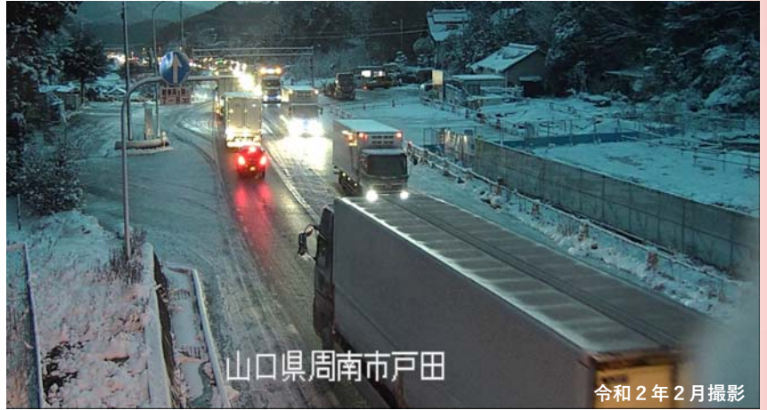
山口県周南市戸田

調査年度:平成28年度～令和2年度 (国土交通省が管理している山口県内の国道2号,9号,188号,190号,191号) 国土交通省山口河川国道事務所の調べによる