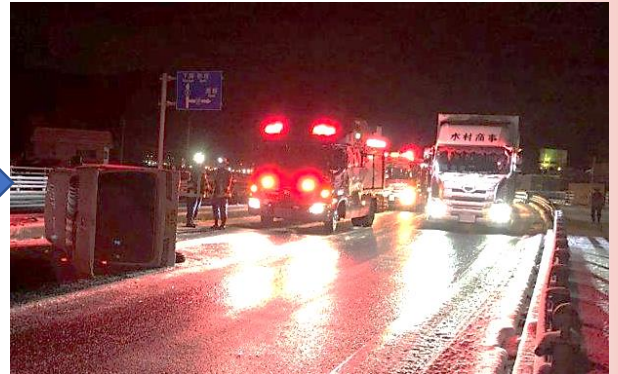
事故処理のための交通障害が発生