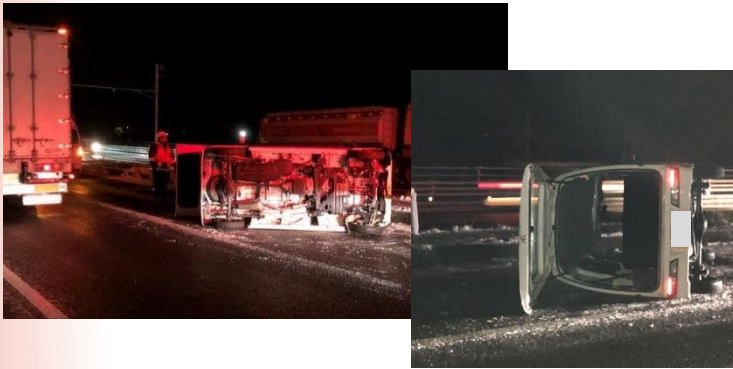
国道2号周南市戸田付近スリップ事故発生

山陽側沿岸部でも冬用タイヤ未装着車による走行不能やスリップ事故により交通障害が発生しています。