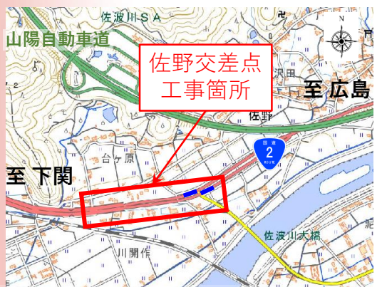
佐野交差点 工事箇所