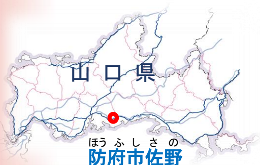
ほうふしきの 防府市佐野