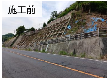
施工前 塩害により植生が枯死 法面洗掘