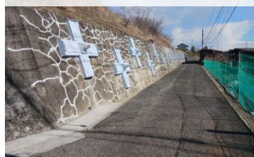
擁壁 亀裂をシーリング 受圧板+グラウンドアンカー