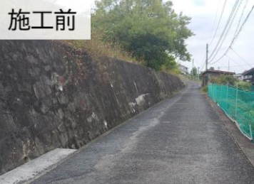
施工前 擁壁 亀裂(ASR)