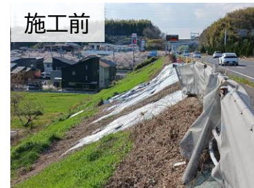
施工前 大雨による法面洗掘