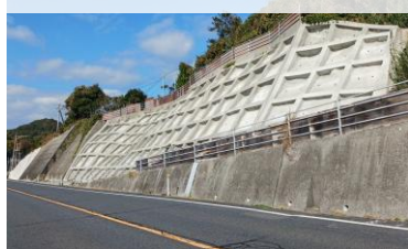
コンクリート吹き付け による法面保護