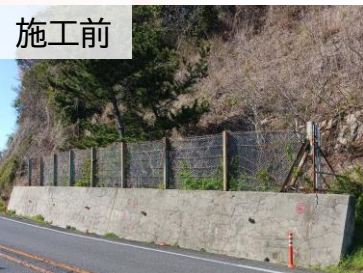
施工前 落石防止柵 老朽化 擁壁 亀裂(ASR)