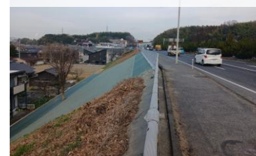
補強盛土を構築 水抜きパイプを設置