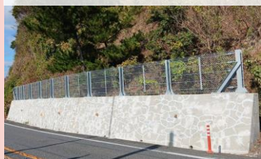
落石防止柵 更新 擁壁 亀裂をシーリング