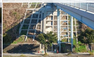
グラウト注入による 法面保護