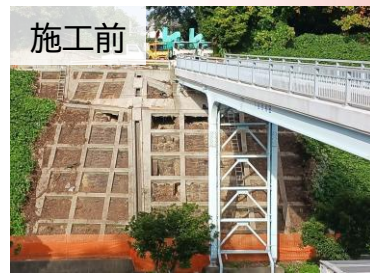
施工前 大雨による法面洗掘