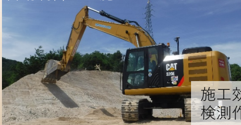
自動制御での施工