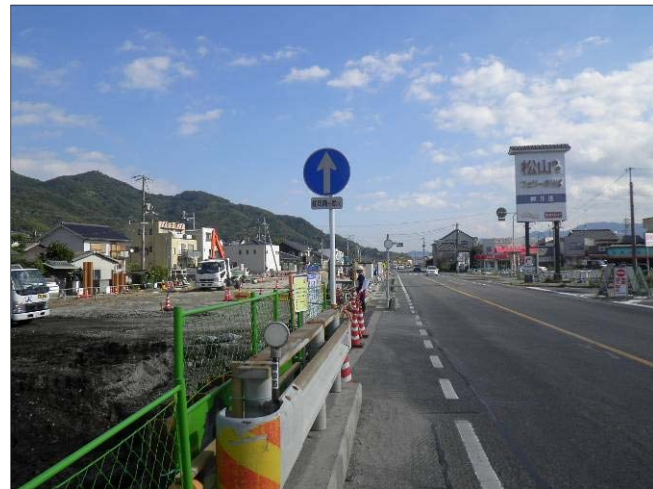
■写真②<11月の施工状況>