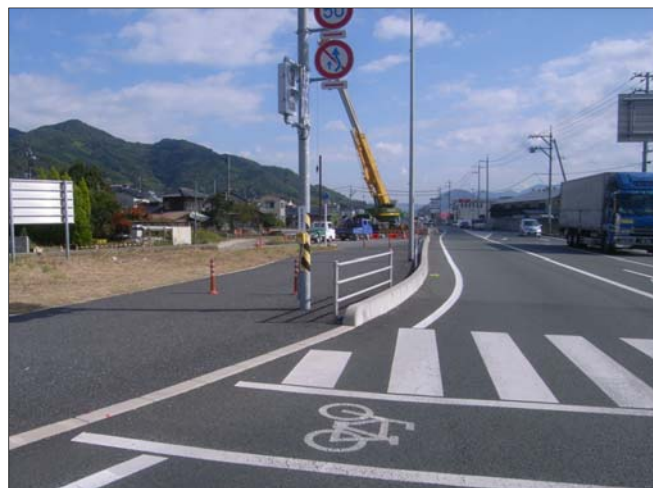
■写真①<11月の施工状況>