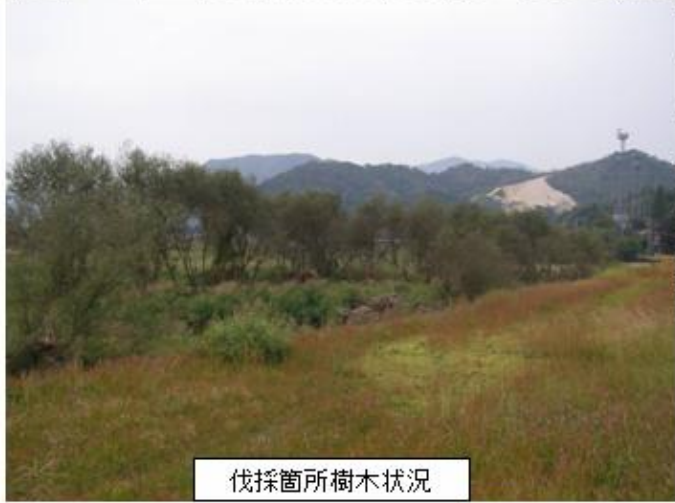
伐採箇所樹木状況