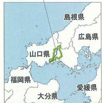
位置図 佐波川流域

①佐波川右岸(上河原・高井地区) ハード: 高水敷整正、河川管理用通路整備、階段整備(国) キャンプ場整備、トイレ整備、駐車場整備(市)