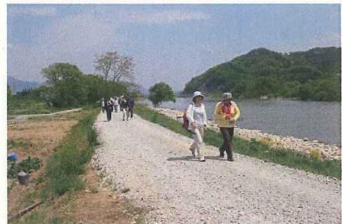
管理用道路をフットパスとして活用（最上川）

ハード支援： 治水上及び河川利用上の安全・安心に係る河川管理施設の整備を通じ、まちづくりと一体となった水辺整備を支援。