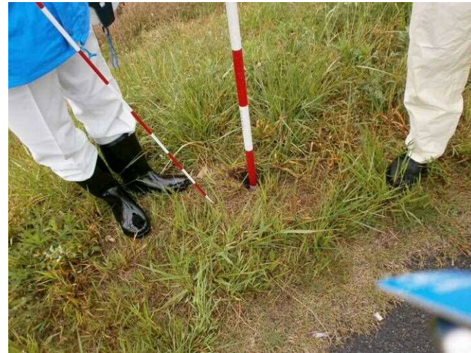
獣穴(モグラ等が巣穴等を作るために掘った穴)