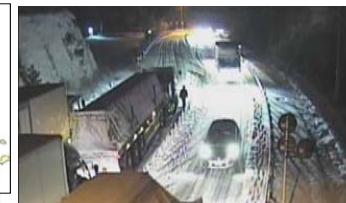
国道2号宇部市吉見での立ち往生発生状況 平成28年1月24日