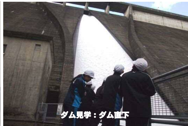
ダム見学：ダム直下