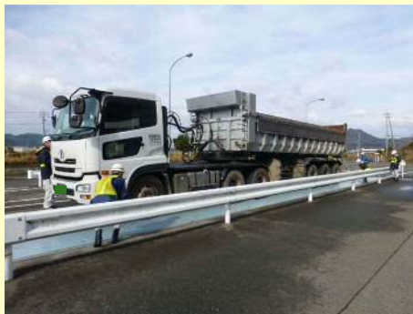
車両総重量不一致違反

今回の取締では、 10台 のうち 9台 の違反があり、是正指導等を行いました。 今年度は現在までに、取締を10回実施して、合計 116台 のうち 81台 に是正指導等を行いました。