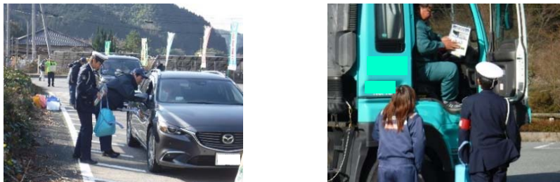
冬用タイヤ早期装着の呼びかけの様子