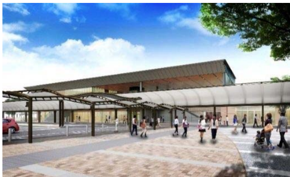
リニューアル後の西口駅前広場イメージ (岩国市資料)