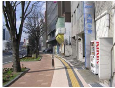
自転車歩行者道（視覚分離）