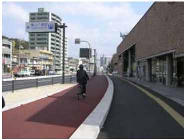
自転車道（構造分離）