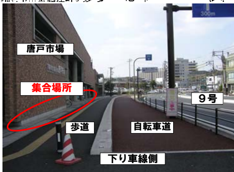
下関市唐戸市場前の交差点から下関駅方面を望む