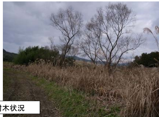
伐採箇所樹木状況