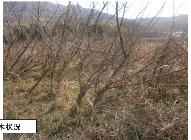
伐採箇所樹木状況