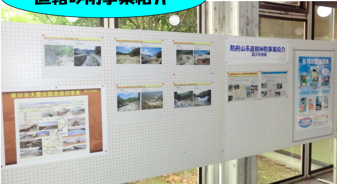
徳地山村開発センター（ロビー）