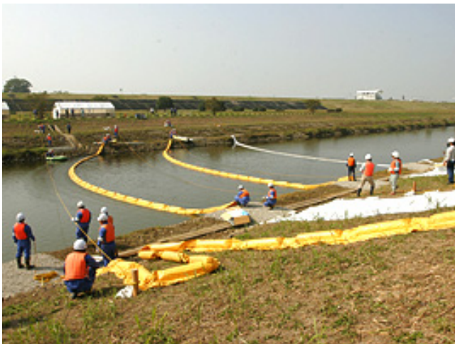
オイルフェンス展張訓練 (他の河川での実施例)

水質事故(化学物質や油類等が流出する事故)が発生した場合、原因物質によって対策が異なりますが、初期段階では原因物質が不明な場合があります。この場合に備え、現場において原因物質を素早く判定するための一連の作業を訓練します。