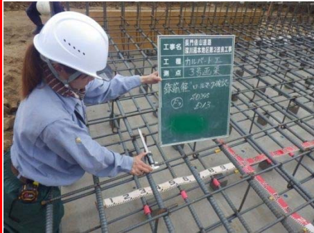
長門俵山道路深川湯本地区第2改良工事