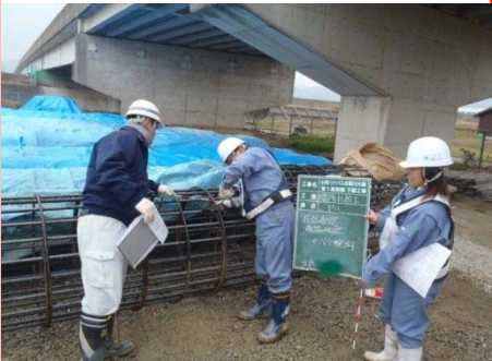
小月バイパス木屋川大橋第1高架橋下部工事