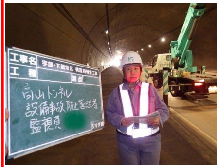
宇部・下関地区構造物補修工事