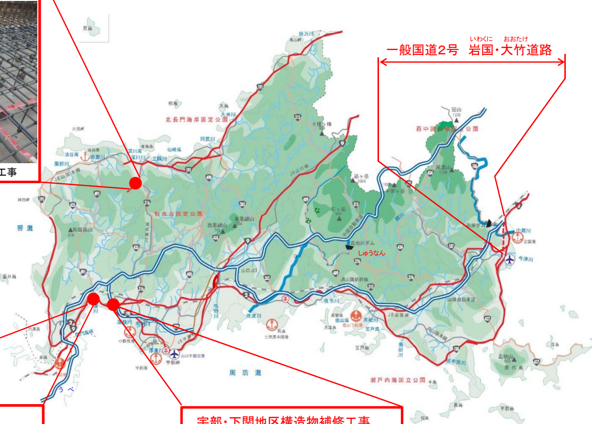
いわくに おおたけ 一般国道2号 岩国・大竹道路