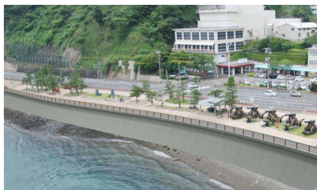
みもすそ川地区完成イメージ