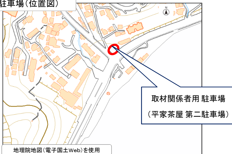
取材関係者用駐車場(位置図)

※レンタカーやタクシーを利用する場合は車両ナンバー欄に「レンタカー」「タクシー」とご記入下さい。