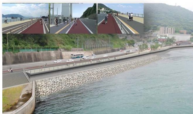
壇ノ浦地区完成イメージ