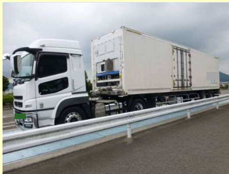
通行条件（誘導車の配置）違反

今回の取締では、11台のうち9台の違反があり、是正指導等を行いました。今年度は現在までに、取締を3回実施して、合計37台のうち30台に是正指導等を行いました。