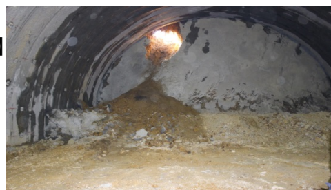
大寧寺第2トンネルの貫通写真(H28.11.24)

また、長門・俵山道路の事業箇所全体の現場についても取材可能ですので、希望の方は事前に連絡をお願いいたします。