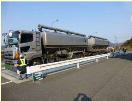
車両総重量不一致違反

今回の取締では、 11台 のうち 8台 の違反があり、是正指導等を行いました。 今年度は現在までに、取締を9回実施して、合計 106台 のうち 72台 に是正指導等を行いました。