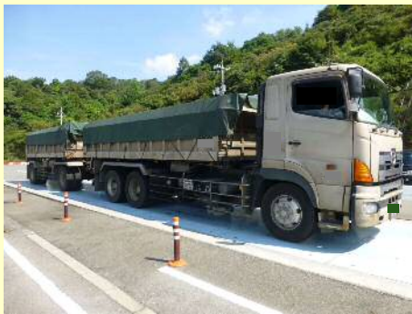
車両総重量不一致違反

今回の取締では、 9台 のうち 6台 の違反があり、是正指導等を行いました。今年度は現在までに、取締を3回実施して、合計 26台 のうち 17台 に是正指導等を行いました。