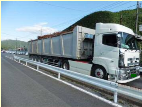
車両総重量不一致違反

今回の取締では、 9台 のうち 5台 の違反があり、是正指導等を行いました。今年度は現在までに、取締を8回実施して、合計 67台 のうち 40台 に是正指導等を行いました。