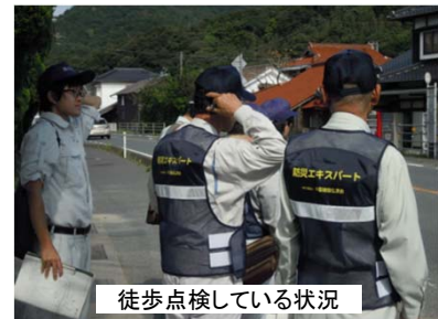
徒歩点検している状況