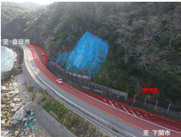
工事箇所の状況（現在）