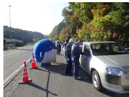
実施状況 (R3.11.19 長門市西深川)