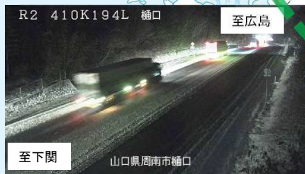
国道2号の積雪状況

現在、山陽道徳山西IC～大竹ICにおいて積雪による通行止めが実施されております。国道2号への迂回は積雪があり、渋滞等が予測されますので、 国道188号への広域迂回をお願い致します。