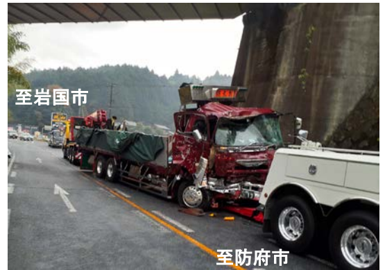
事故状況 周南市大河内 令和3年12月3日発生