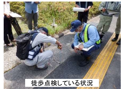
徒歩点検している状況 【R3年度実施点検状況】