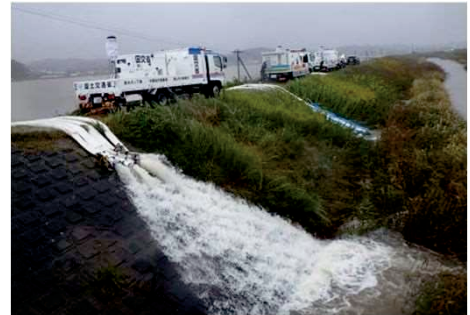
令和元年台風19号 排水ポンプ車活動