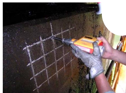
シュミットハンマによる調査状況