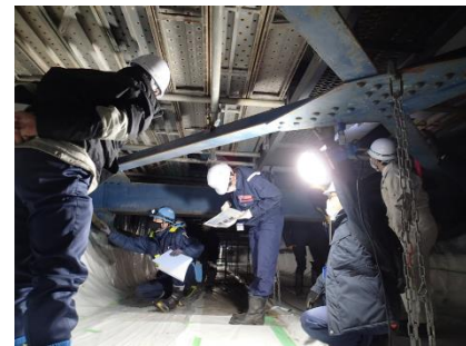
橋梁点検の実習状況（イメージ）