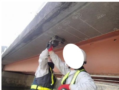
鉄筋探査による調査状況