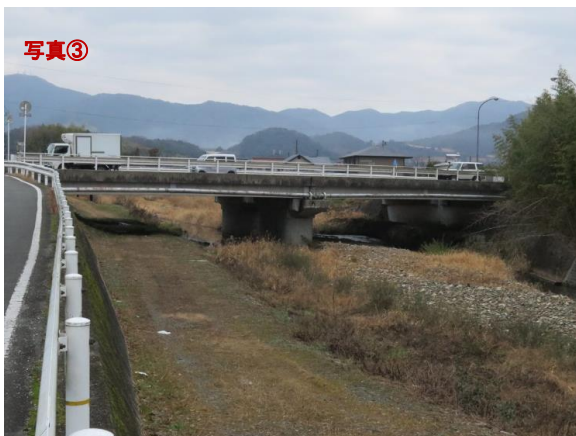
集合場所、実習の箇所