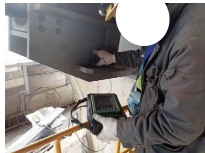
超音波探傷試験による調査状況