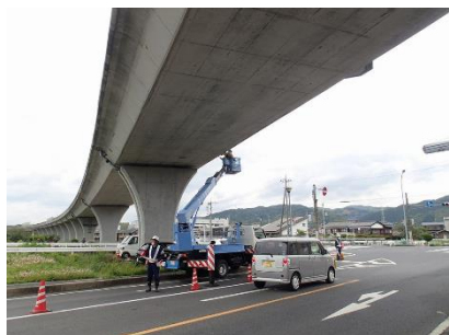
リフト車上での点検状況