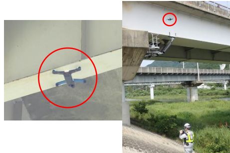
ドローン点検の状況