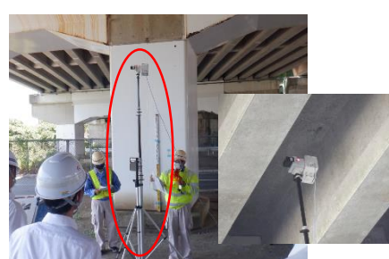
橋梁点検ロボットカメラによる点検状況