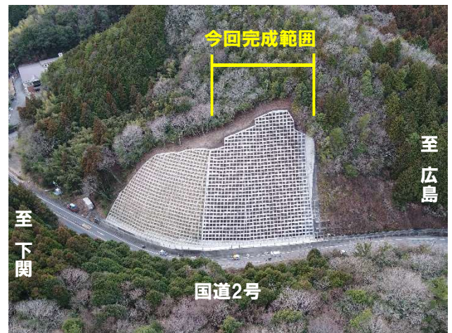
補強工事完成写真（R5.2）

※現地取材を希望される方は山口河川国道事務所道路管理第二課まで事前に申込をお願いします。