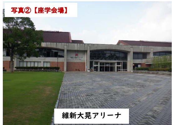
維新大晃アリーナ