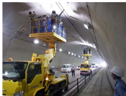
【昨年度のトンネル点検勉強会の状況】