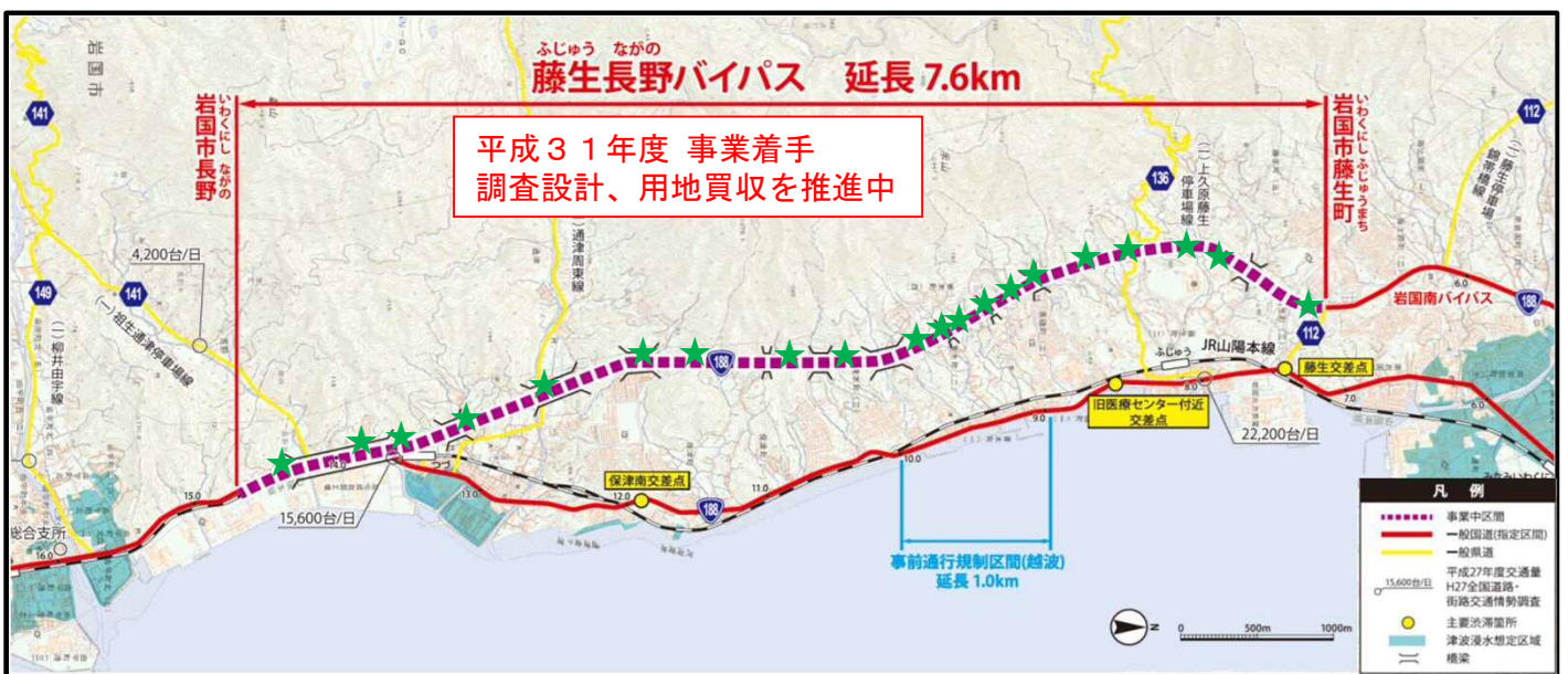
国土地理院地図を加工して使用