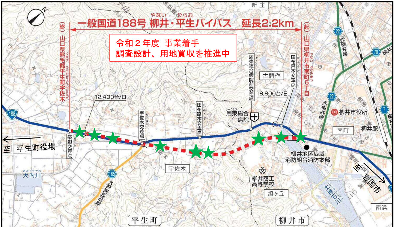
国土地理院地図を加工して使用