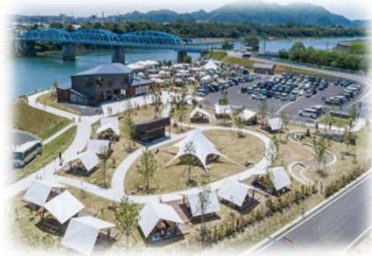
民間事業者の参加 (信濃川/新潟市)