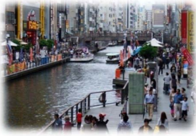
遊歩道の民間活用 (道頓堀川/大阪市)