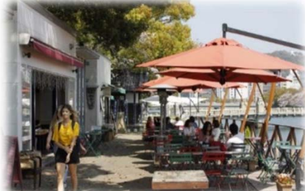
オープンカフェの設置 (京橋川/広島市)