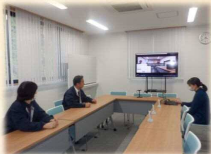
会議室に配備されたテレビ会議システム

また、太陽光発電設備についても再生可能エネルギーの利用促進を図ると言うことで導入を決めました。ただ、昨今の半導体不足の影響で、残念ながら令和4年11月20日の落成式には間に合いませんでした。太陽光発電により大規模な災害が発生した際に天候次第とはなりますが、更に長期間の運用が図れることとなります。