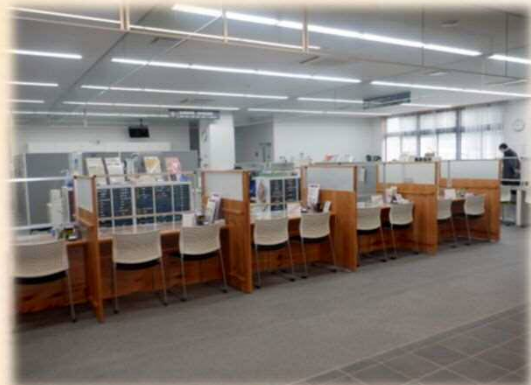
滑松が使用された窓口のカウンター

あまり知られていないというか、細かいところなのですが、浸水が発生した際の排水対策として周辺の水路の整備を実施しています。仮に浸水が発生しても早期に復旧が図れるよう整備したもので、まさに見えないこだわりかもしれません。