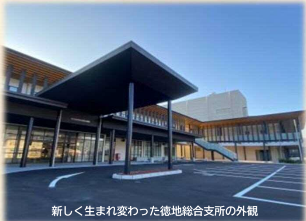
新しく生まれ変わった徳地総合支所の外観

診療所機能が一体化したことで常に住民の方を施設内に見かけるようになりました。診療所の待ち時間を使って行政サービスの手続きを行うことが出来るようになり地域の方がより便利に利用されていると感じています。