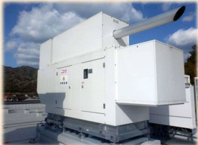
屋上に設置された発電機