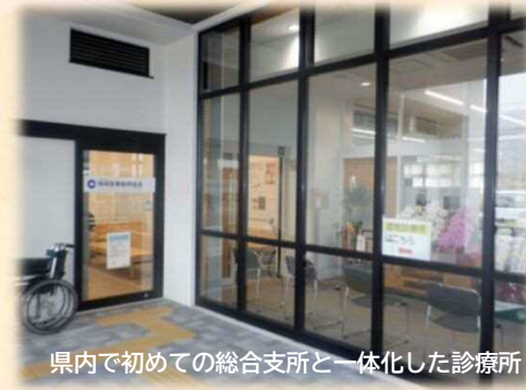
県内で初めての総合支所と一体化した診療所