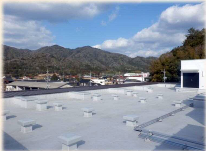
屋上の太陽光発電パネル設置予定箇所