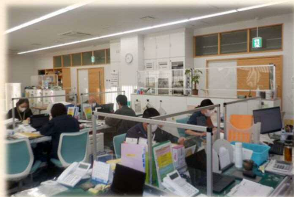
徳地総合支所で地域の安全安心のため、勤務する土木課の皆様

問: 新しくなった徳地地域複合型拠点施設でこれまでの総合支所と大きく変わったことは何ですか？