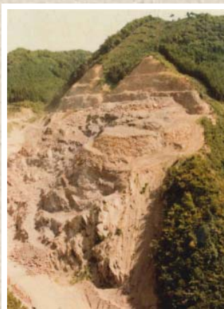
ダム建設当時の原石山