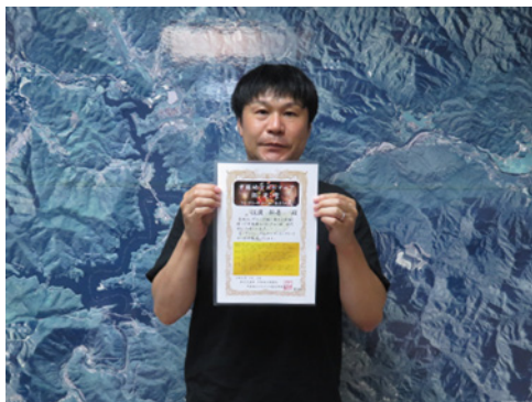
(P.N.) えび さん 【8/14】