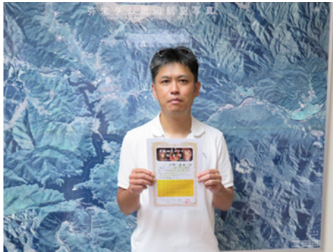
(P.N.) たまひな さん [7/22] 「家族の協力で達成できました」

コンプリートコースは、中国地方の全てのダムカード（81ヶ所）をそろえた方が認定されます。81ヶ所の中には、離島（隠岐・見島など）があるので、コンプリートするのは至難の業です。ここに掲載されている方々は、その困難を乗り越えて、見事、コンプリートされたすごい方々です。おめでとうございます！！そして、認定場所として弥栄ダムを選んでいただき、ありがとうございました。