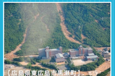
【広島県東広島市黒瀬町】