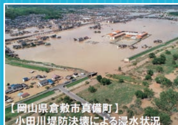
【岡山県倉敷市真備町】 小田川堤防決壊による浸水状況