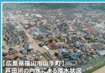
【広島県福山市山手町】 芦田川の内水による浸水状況