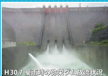
H30.7 豪雨時の弥栄ダム放流状況

サンチャロウまつり会場では、弥栄ダムブースにて、ダム関連及び平成30年7月豪雨等のパネルを展示します。弥栄ダムの効果や災害への備え等について学ぶことができます。