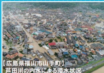
【広島県福山市山手町】 芦田川の内水による浸水状況