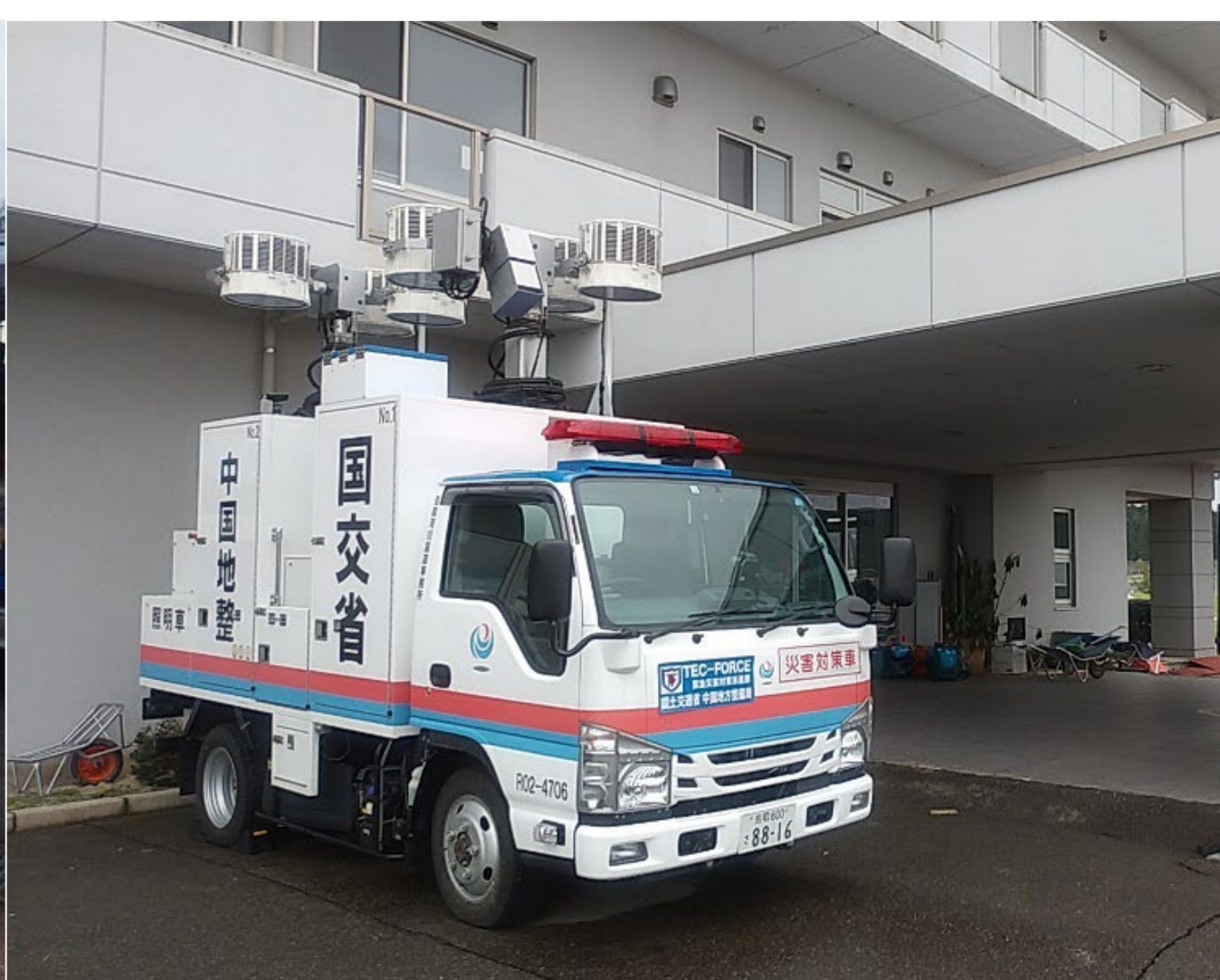
照明車による電源供給支援(石川県珠洲市 現地支援班)