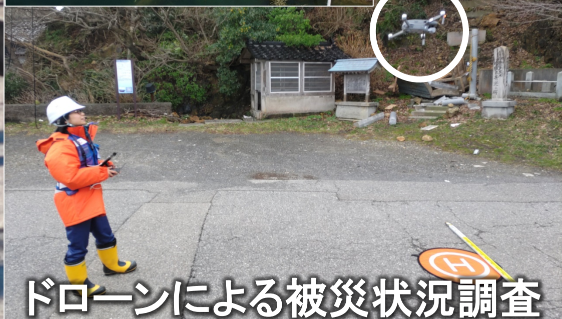
ドローンによる被災状況調査