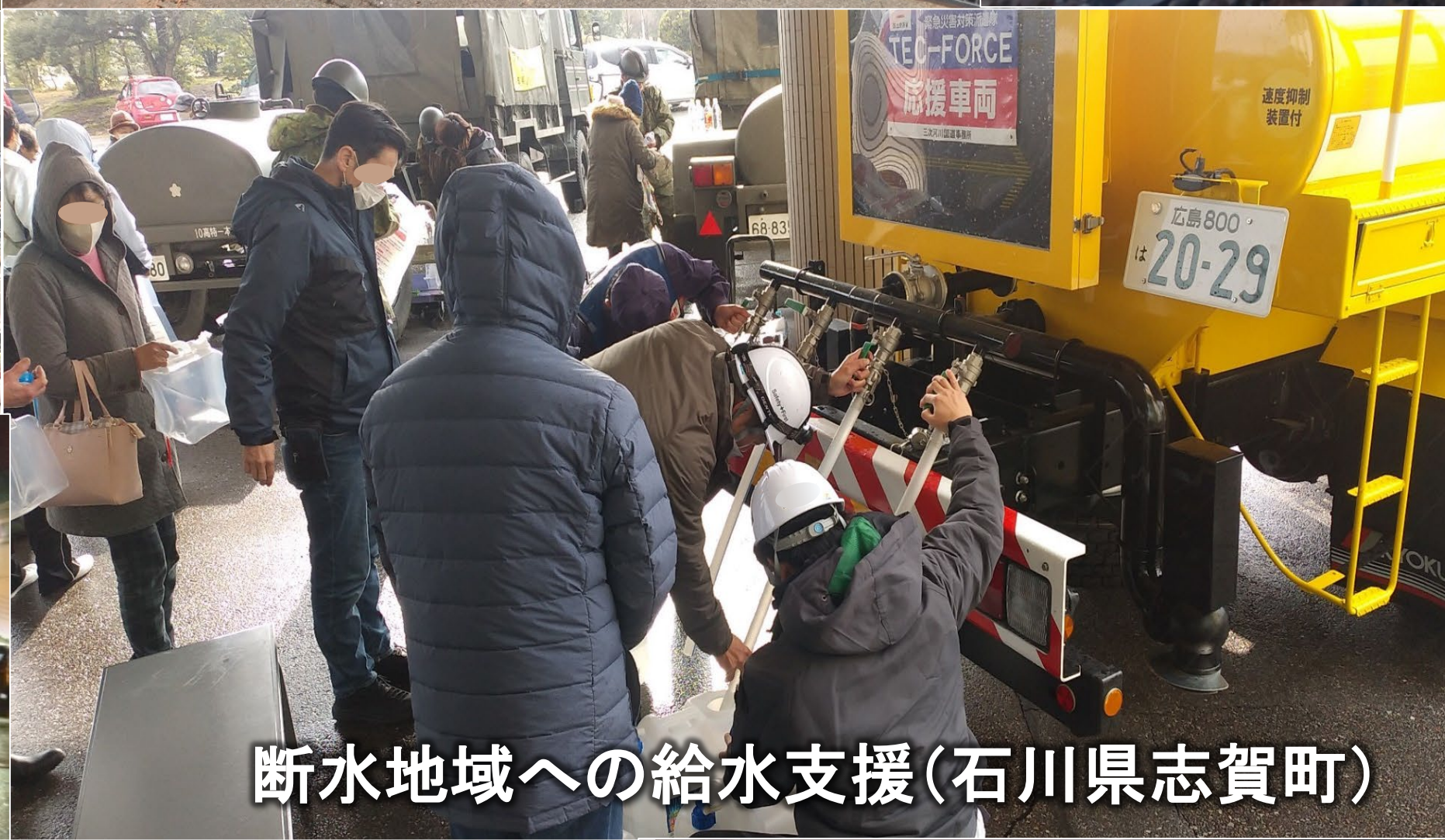
断水地域への給水支援(石川県志賀町)