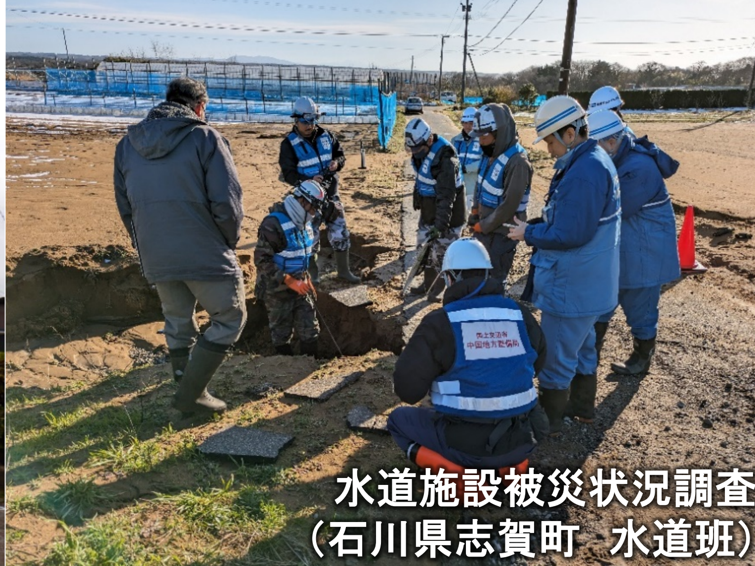
水道施設被災状況調査 (石川県志賀町 水道班)