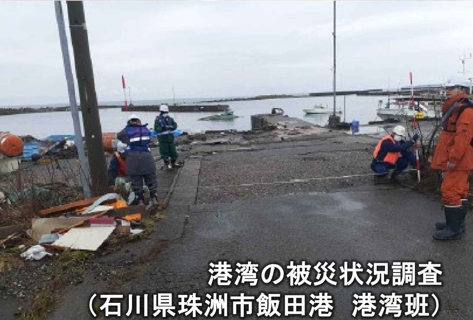
港湾の被災状況調査 (石川県珠洲市飯田港 港湾班)