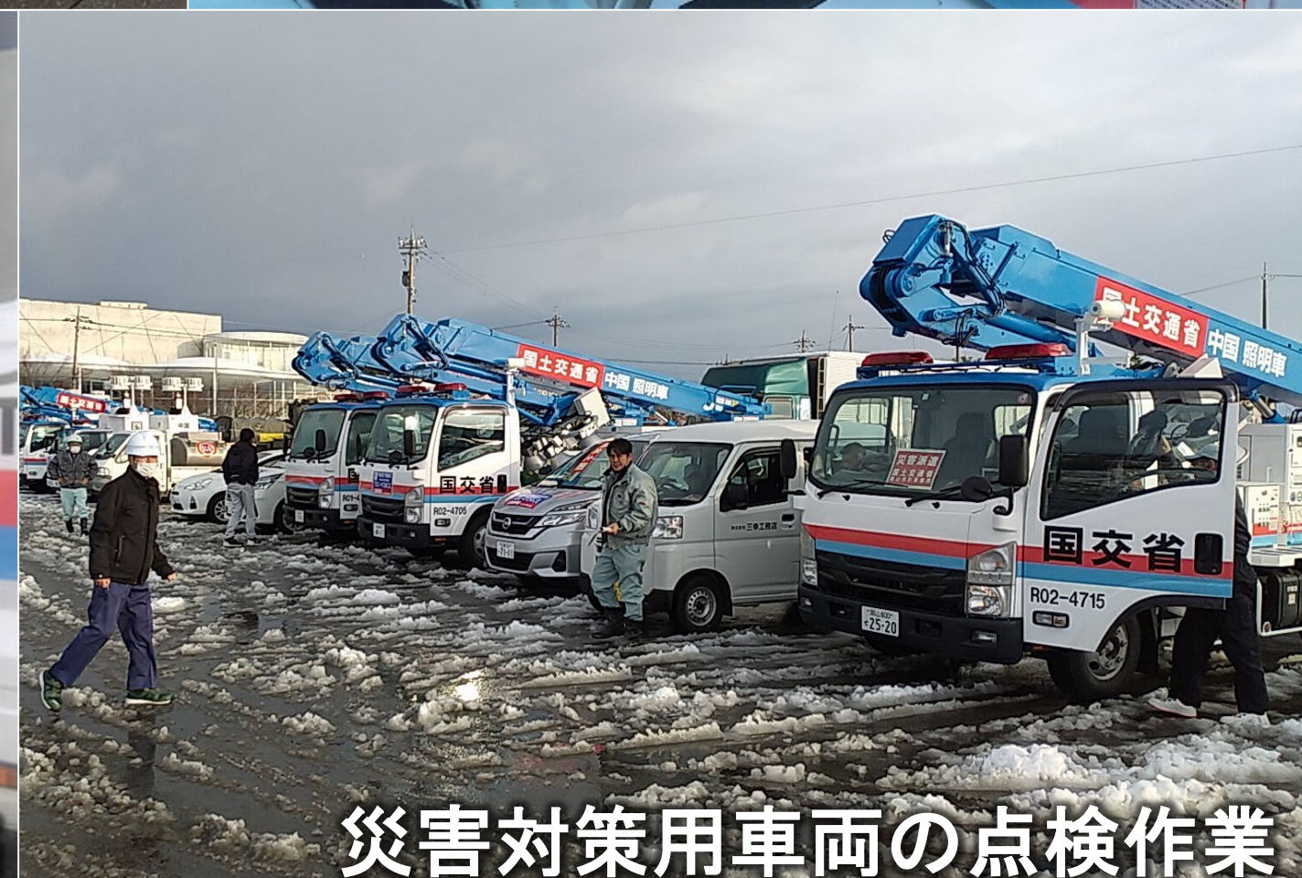
災害対策用車両の点検作業