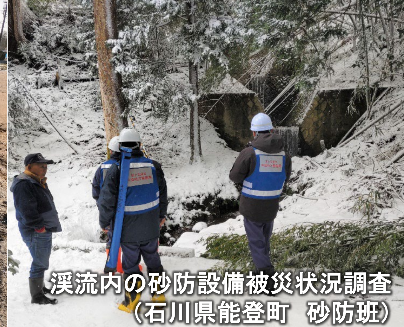
溪流内の砂防設備被災状況調査 (石川県能登町 砂防班)