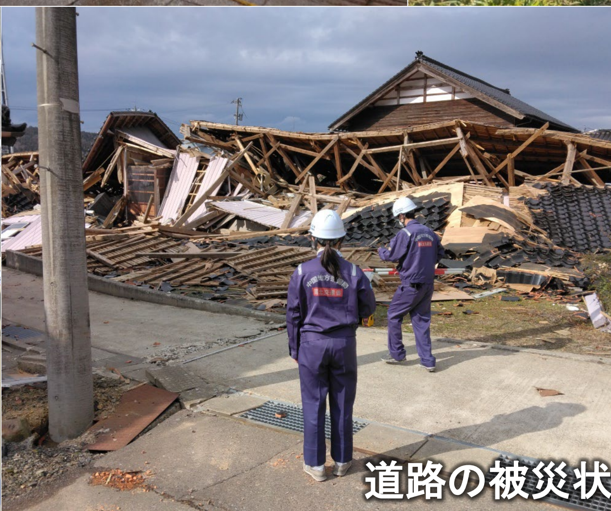
道路の被災状況調査(石川県輪島市 道路班)