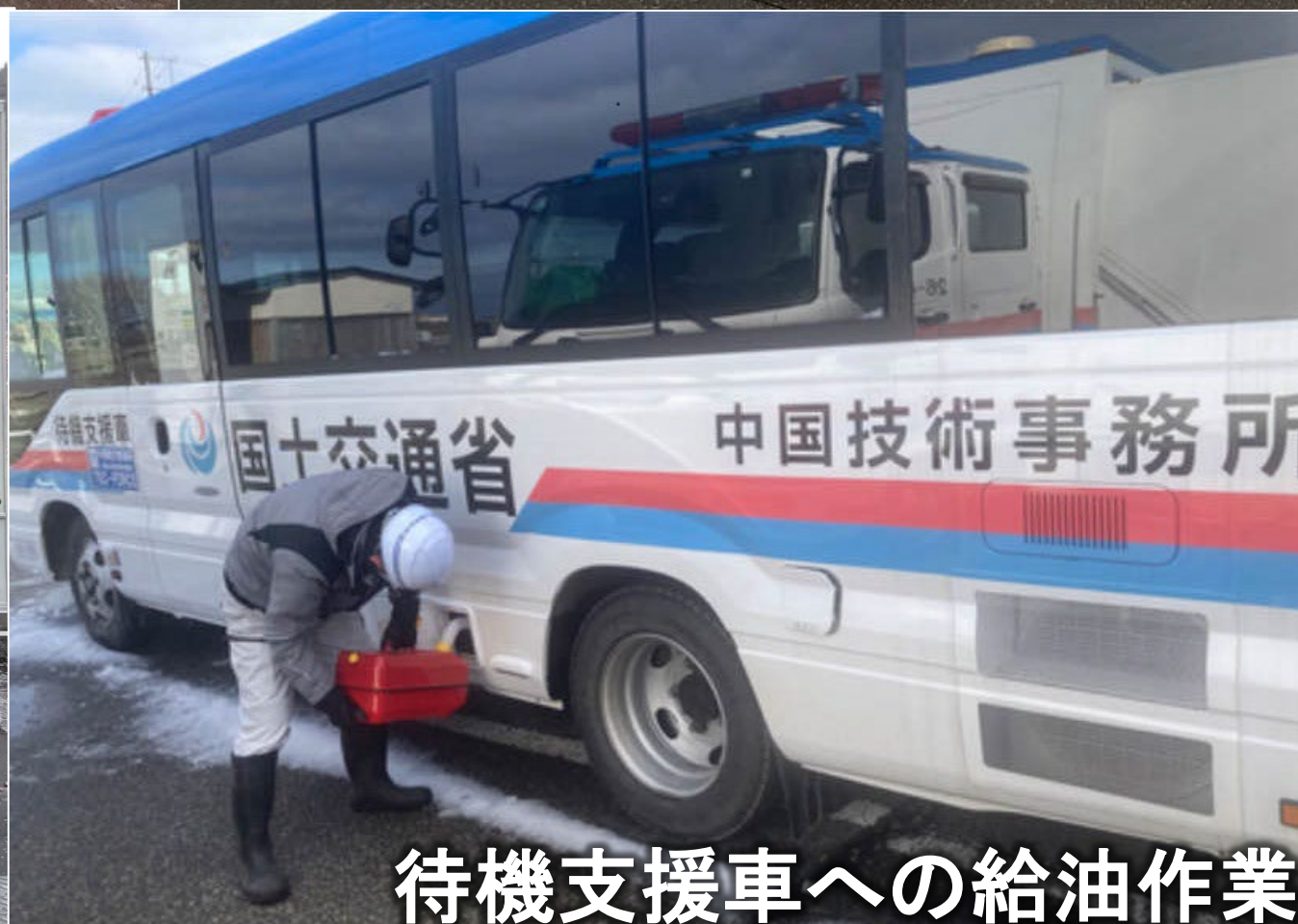
待機支援車への給油作業