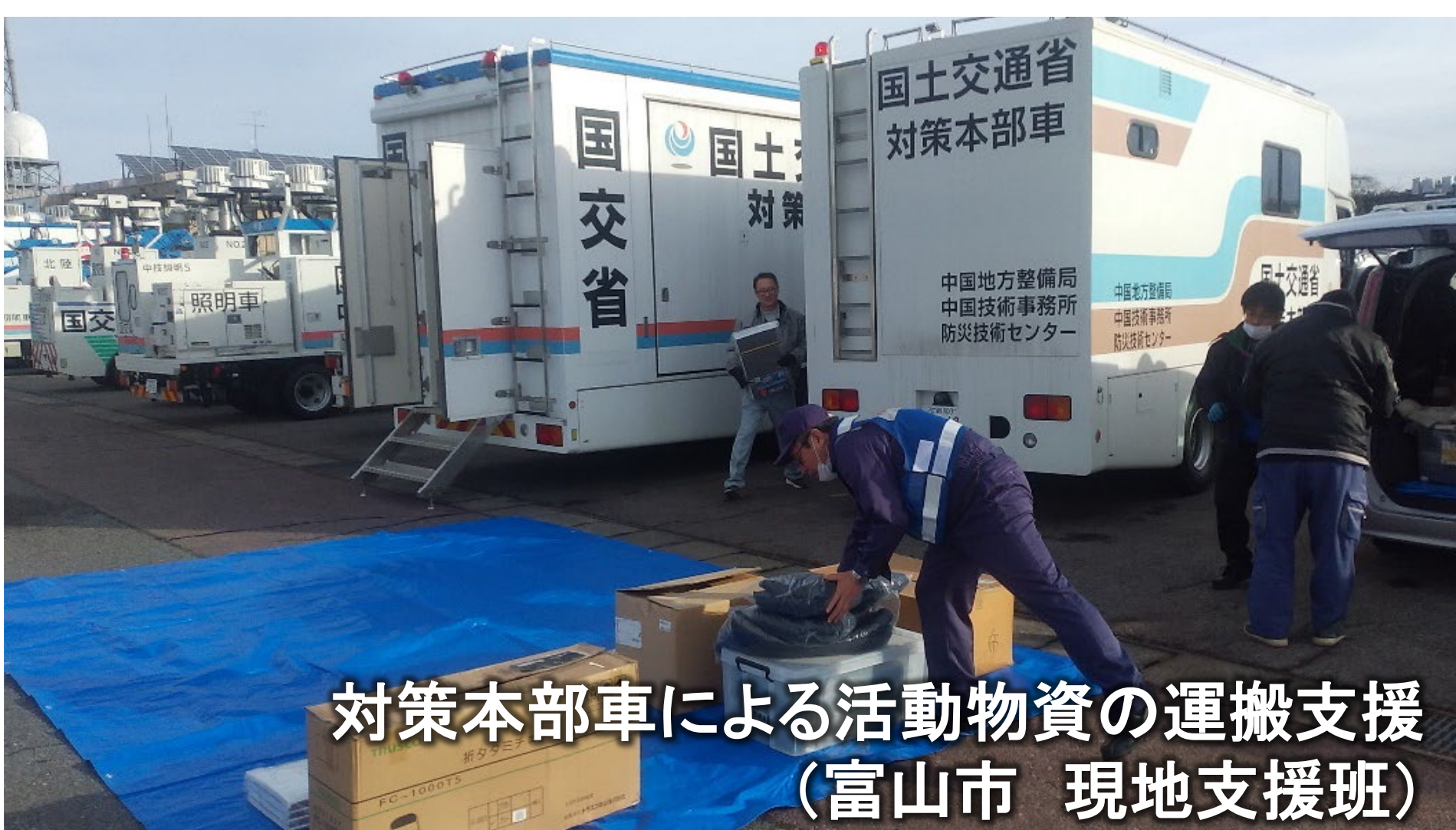
対策本部車による活動物資の運搬支援(富山市 現地支援班)