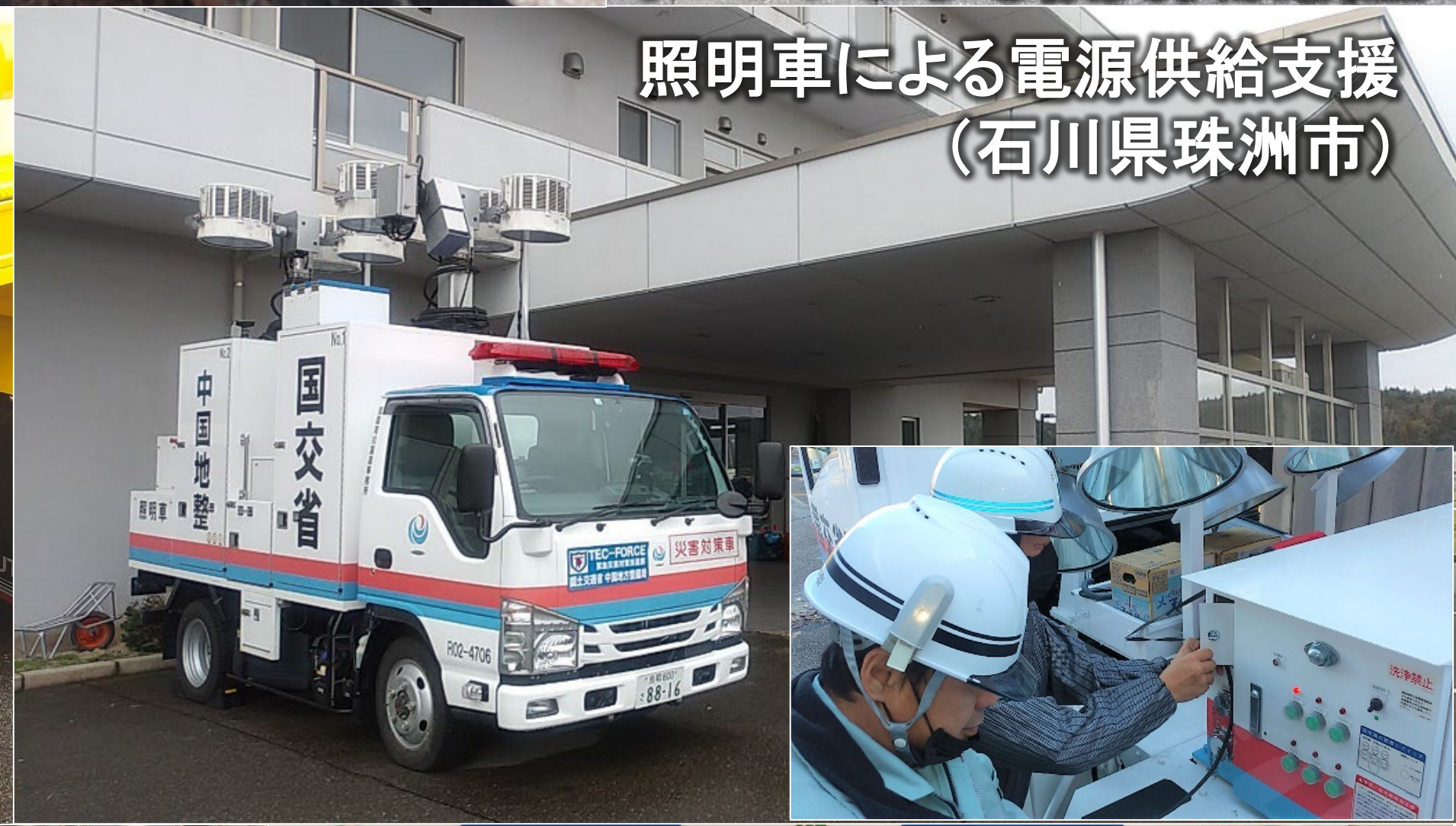
照明車による電源供給支援 (石川県珠洲市)