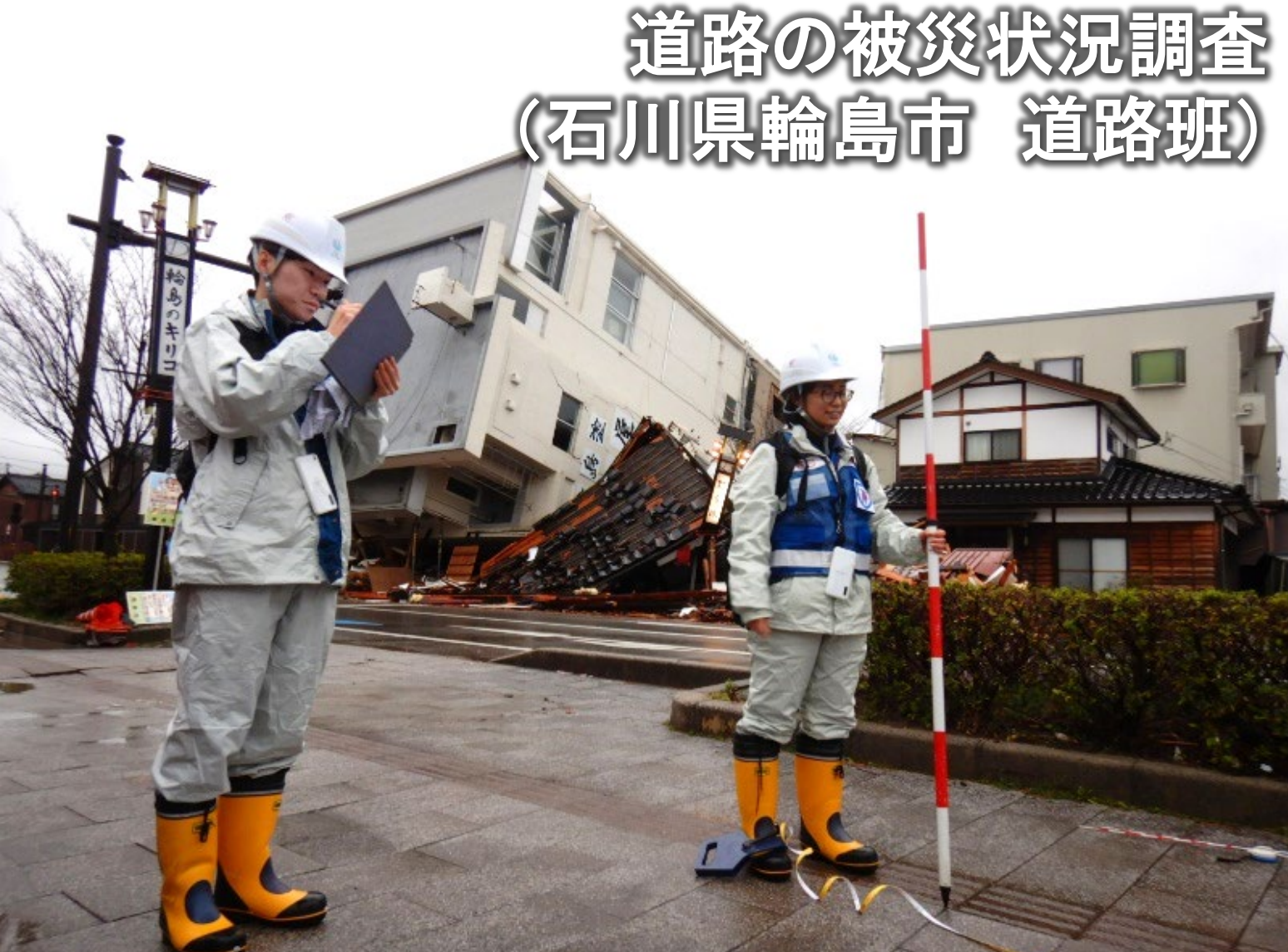
道路の被災状況調査 (石川県輪島市 道路班)