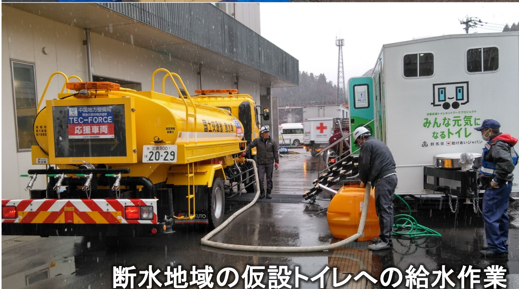
断水地域の仮設トイレへの給水作業