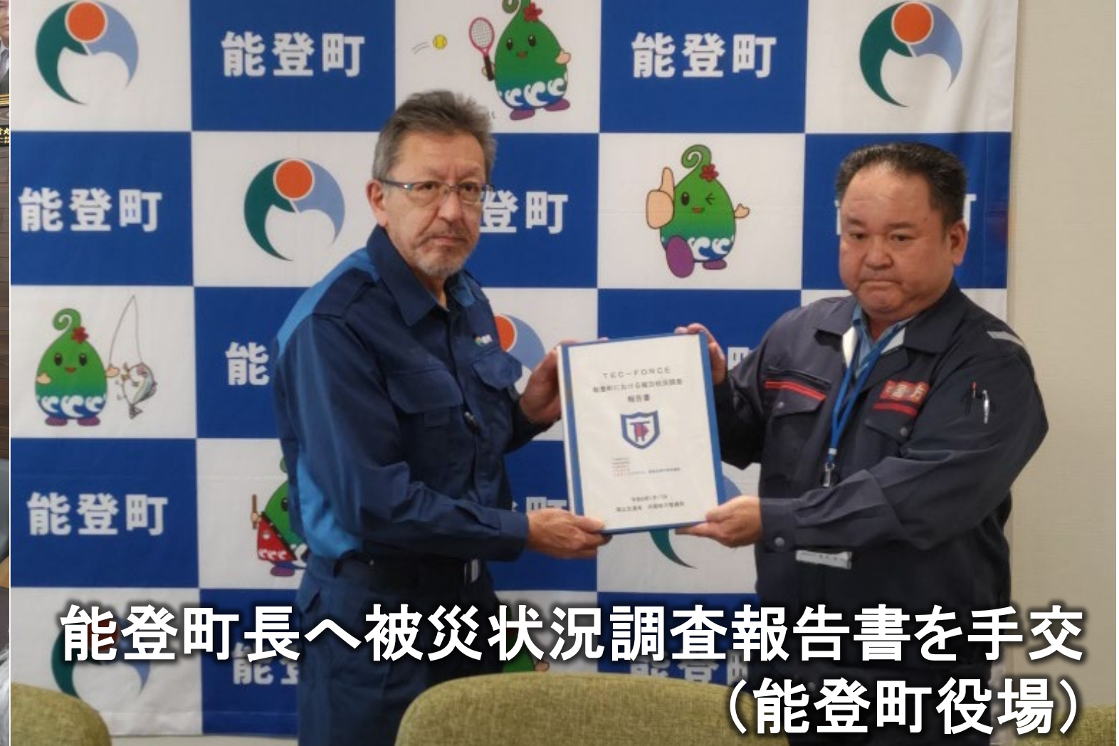
能登町長へ被災状況調査報告書を手交 (能登町役場)

○令和6年1月1日石川県能登地方を震源とする最大震度7及び5強の地震が発生、日本海側に大津波警報が発令され地震と津波により甚大な被害を被る。 ○被災地支援のため各地(石川県輪島市、珠洲市、能登町、志賀町等)にTEC-FORCEを派遣し被災状況調査等を実施。 ○断水となった地域における給水機能付散水車による給水支援や停電が長期にわたる避難所等において照明車を電源車として派遣し電源支援を実施。 ○中国地方から40社の企業のご協力をいただき、災害対策用機械による支援活動等を支えていただいた。