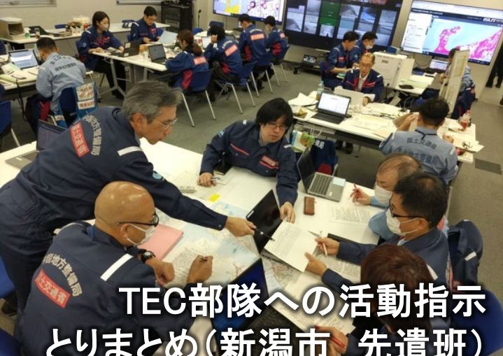
TEC部隊への活動指示とりまとめ(新潟市 先遣班)