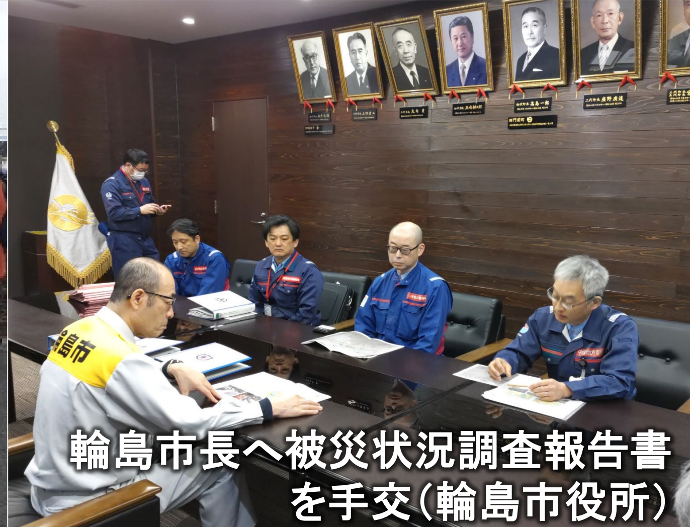
輪島市長へ被災状況調査報告書を手交(輪島市役所)