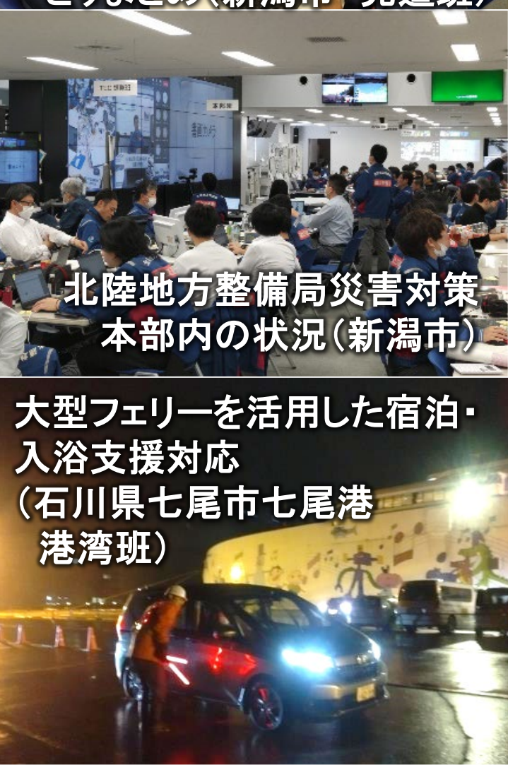
大型フェリーを活用した宿泊・入浴支援対応 (石川県七尾市七尾港 港湾班)