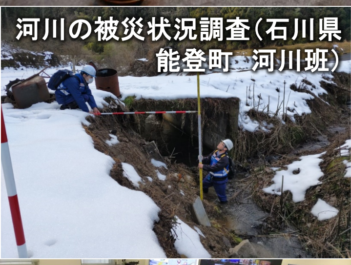
河川の被災状況調査(石川県能登町 河川班)