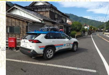
①国道482号鳥取市佐治町付近の調査