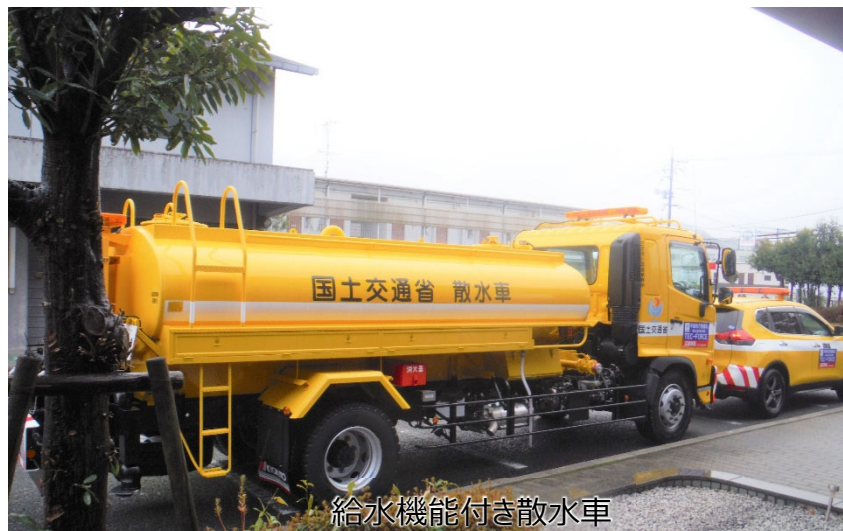
給水機能付き散水車