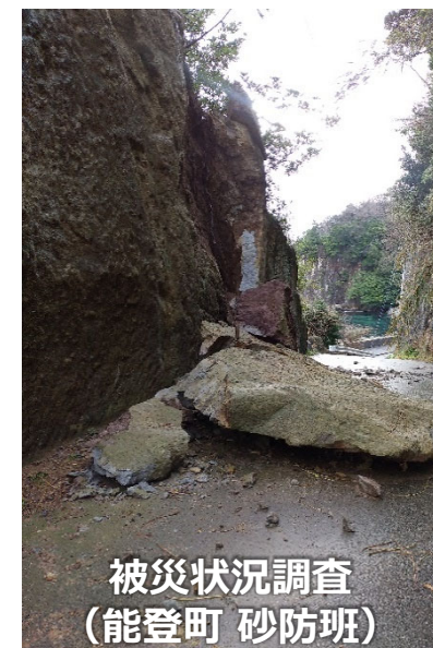
被災状況調査 (能登町 砂防班)