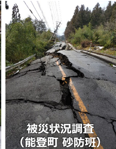
被災状況調査 (能登町 砂防班)