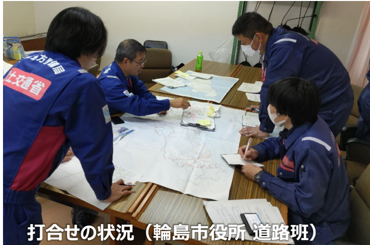
打合せの状況 (輪島市役所 道路班)