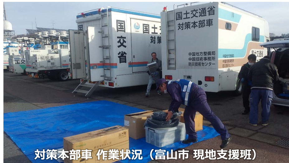
対策本部車 作業状況 (富山市 現地支援班)