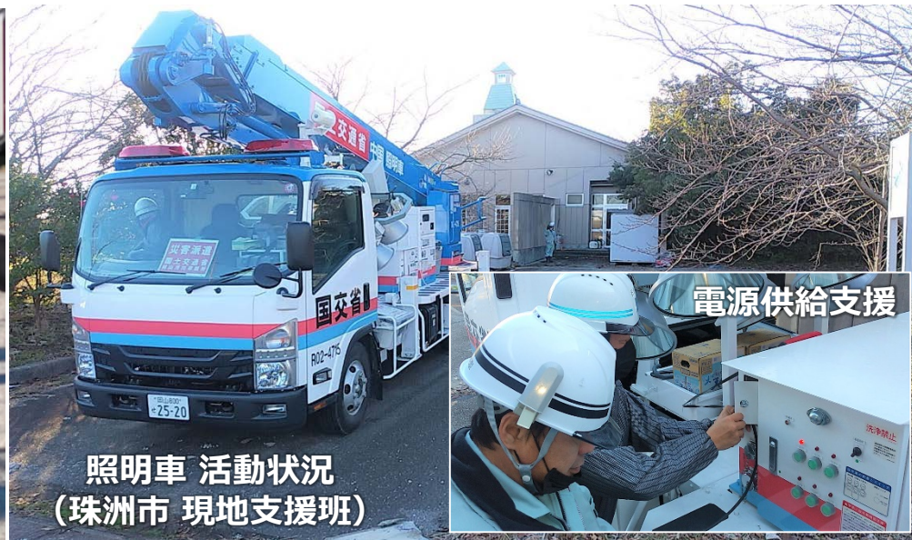
照明車 活動状況 (珠洲市 現地支援班)