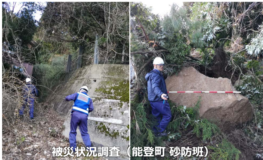
被災状況調査 (能登町 砂防班)