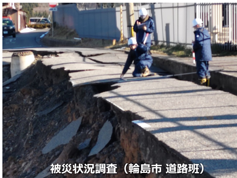
被災状況調査 (輪島市 道路班)