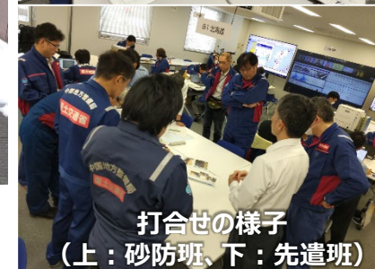
被災状況調査 (輪島市 道路班)