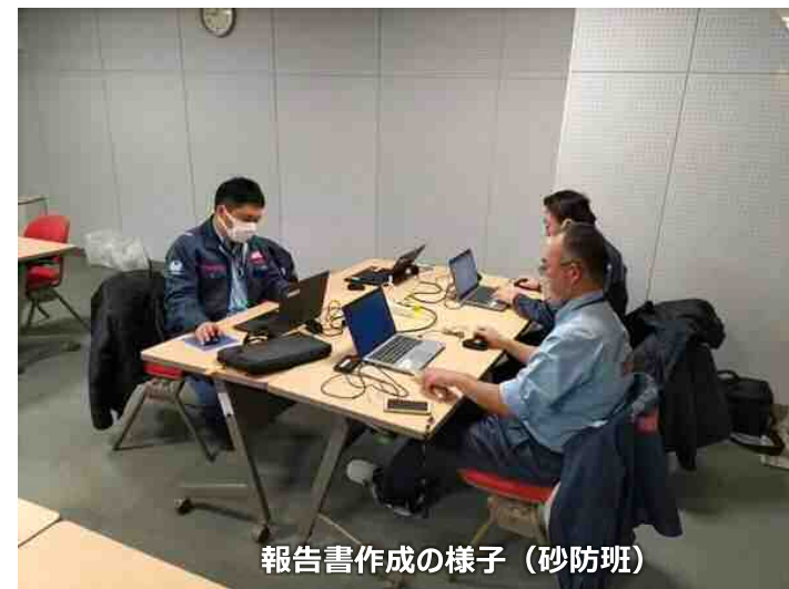
報告書作成の様子 (砂防班)