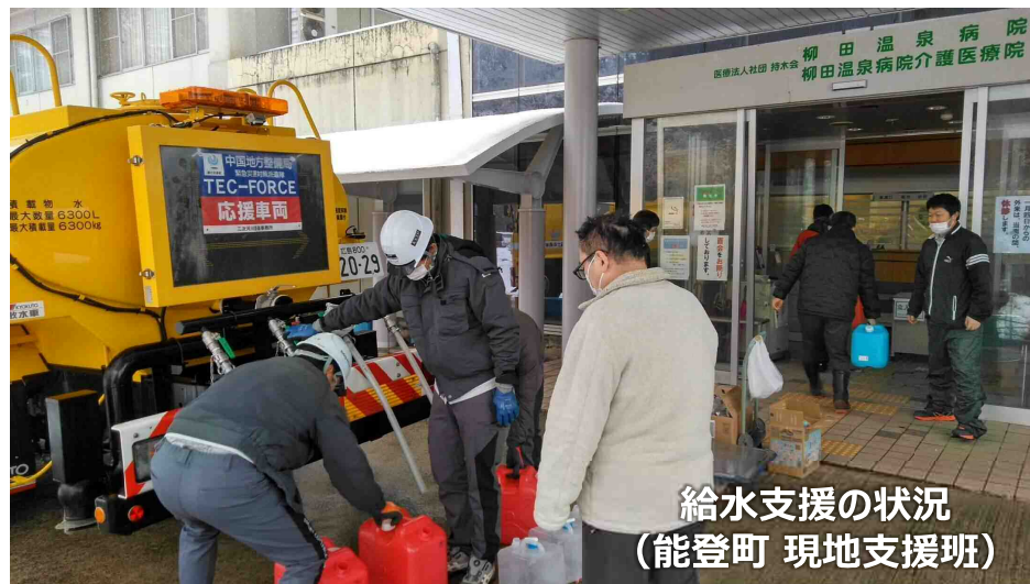
給水支援の状況 (能登町 現地支援班)