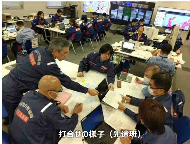
打合せの様子 (先遣班)