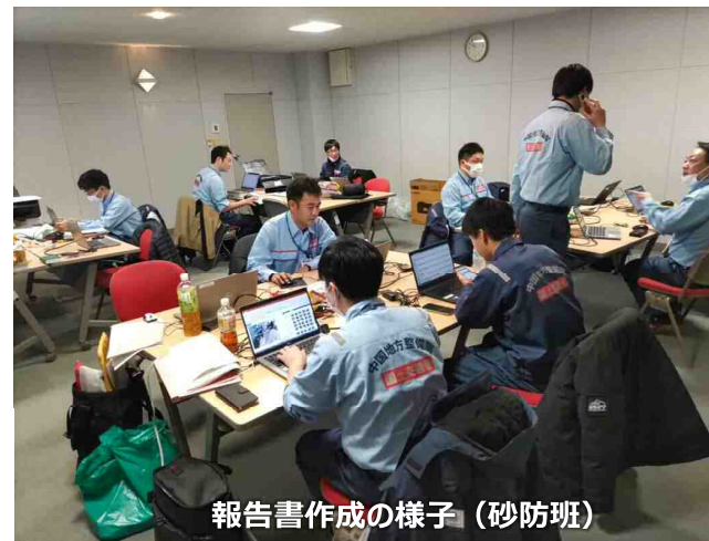
報告書作成の様子 (砂防班)