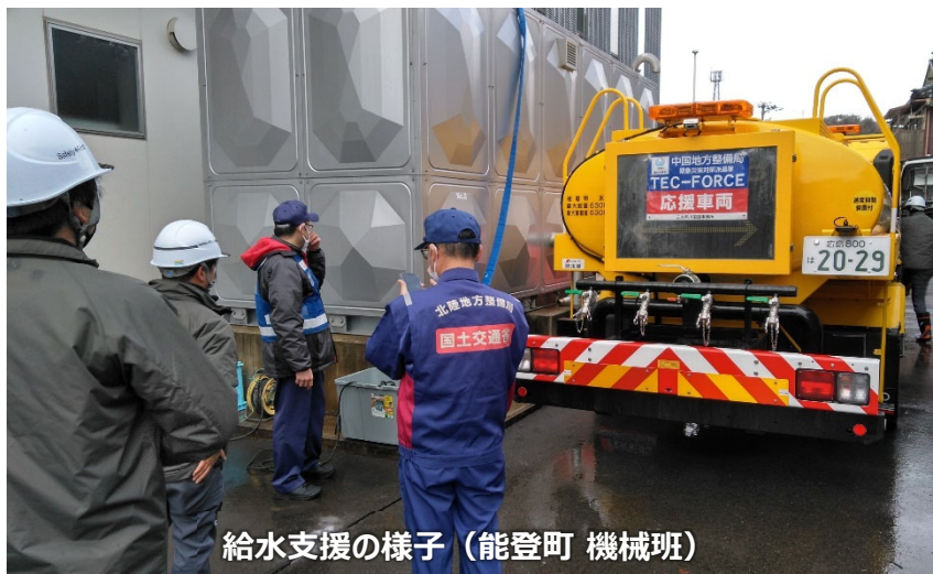
給水支援の様子（能登町 機械班）