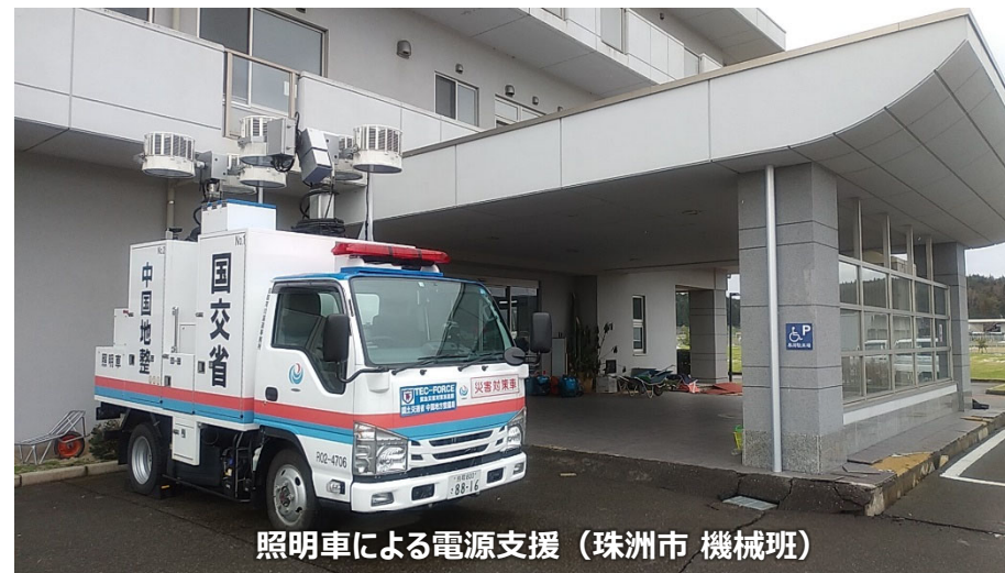
照明車による電源支援（珠州市 機械班）