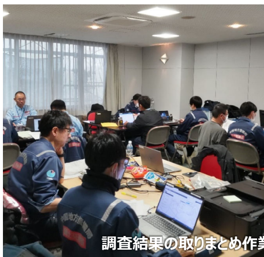
調査結果の取りまとめ作業（金沢市 砂防班・道路班）