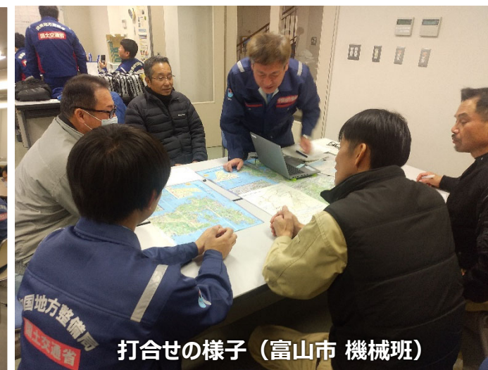
打合せの様子（富山市 機械班）